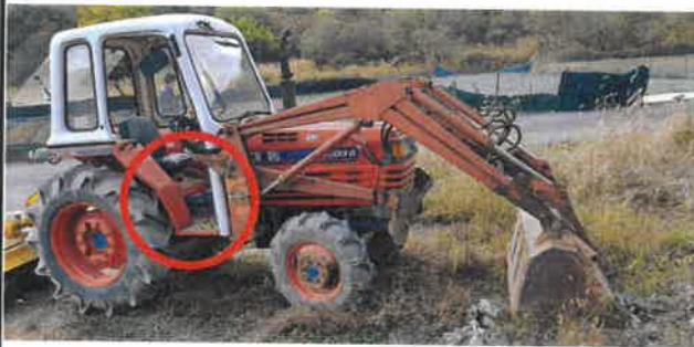
조수석으로 하차中 추락 주장