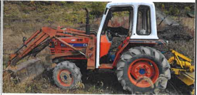
피보험자 소유 트랙터(35HP) 확인